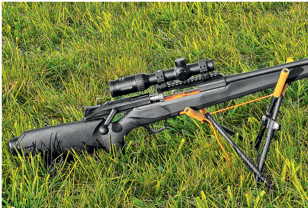
Oben: Der Schnellverschluss von Recknagel (ERA LOC) fasst den neuen Titanschalldämpfer Recknagel ERA Silencer STI 3D. Unten: Das Magazin ist in orange gehalten und nimmt fünf Patronen auf.