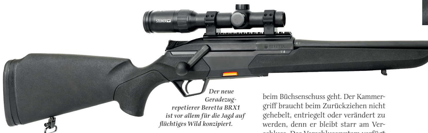
Der neue Geradezugrepetierer Beretta BRX1 ist vor allem für die Jagd auf flüchtiges Wild konzipiert.

Ich bin auf dem Schießstand für den „Laufenden Keiler“, lade den Geradezugrepetierer mit linearem Repetiersystem und rufe die Scheibe per Tastendruck ab. Die Beretta BRX1 liegt perfekt im Anschlag, und der Keiler bewegt sich aus dem Tunnel. Ich erfasse die Scheibe vertikal, ziehe am Wurf mit, und schon ist der Schuss draußen. Ein weiterer Tastendruck lässt den Keiler in die andere Richtung „flüchten“. Beim Steiner Ranger 6 1–6×24 habe ich die Absehenbeleuchtung auf Stufe 10 eingestellt. Die Leuchstärke passt perfekt, und schon nimmt der Rotpunkt die Scheibe auf, ich ziehe mit und der nächste Schuss bricht. Der Rückstoß der .30-06 Spr. ist kaum zu spüren, denn der neue Titanschalldämpfer von Recknagel namens ERA Silencer STI 3D schluckt nicht nur viel des Schalldrucks, sondern gefühlt auch beinahe den gesamten Rückstoß. Nach zehn Schüssen ist er